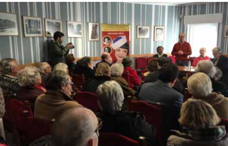
Imagem e identidade da Freguesia de Santo António

- Criação da entidade visual “Valor Humano”.