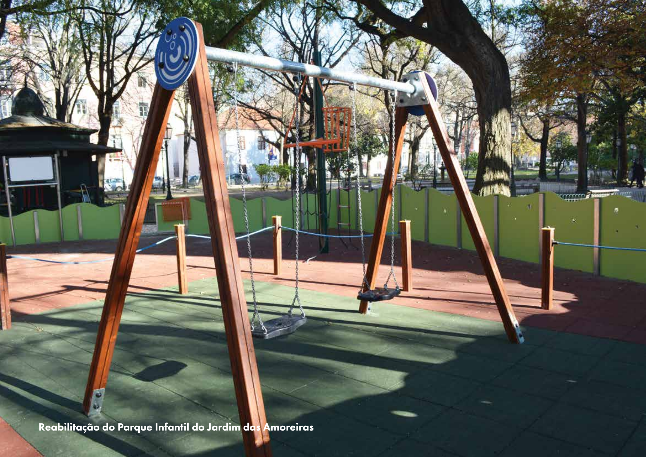
Reabilitação do Parque Infantil do Jardim das Amoreiras