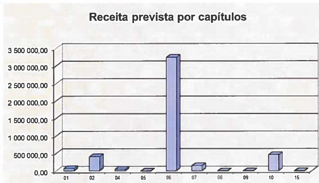
Gráfico n.º 1- receita prevista por capítulos